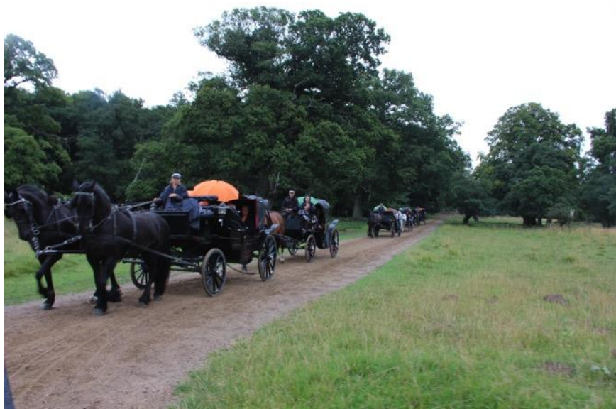
På hestevognsturen igennem Dyrehaven nyder vi den dejlige natur på trods af regn.