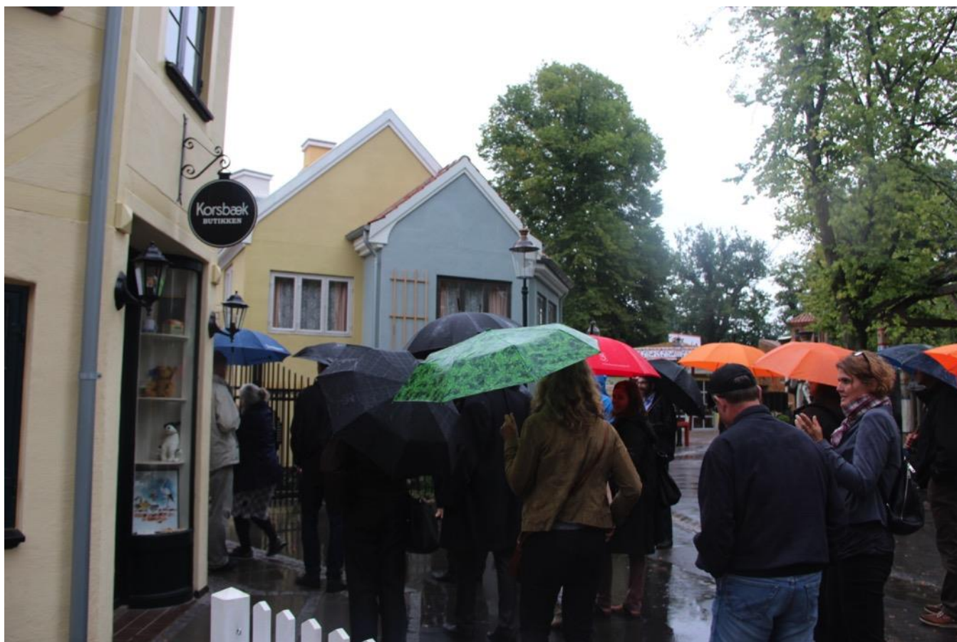
Korsbæk på Bakken.