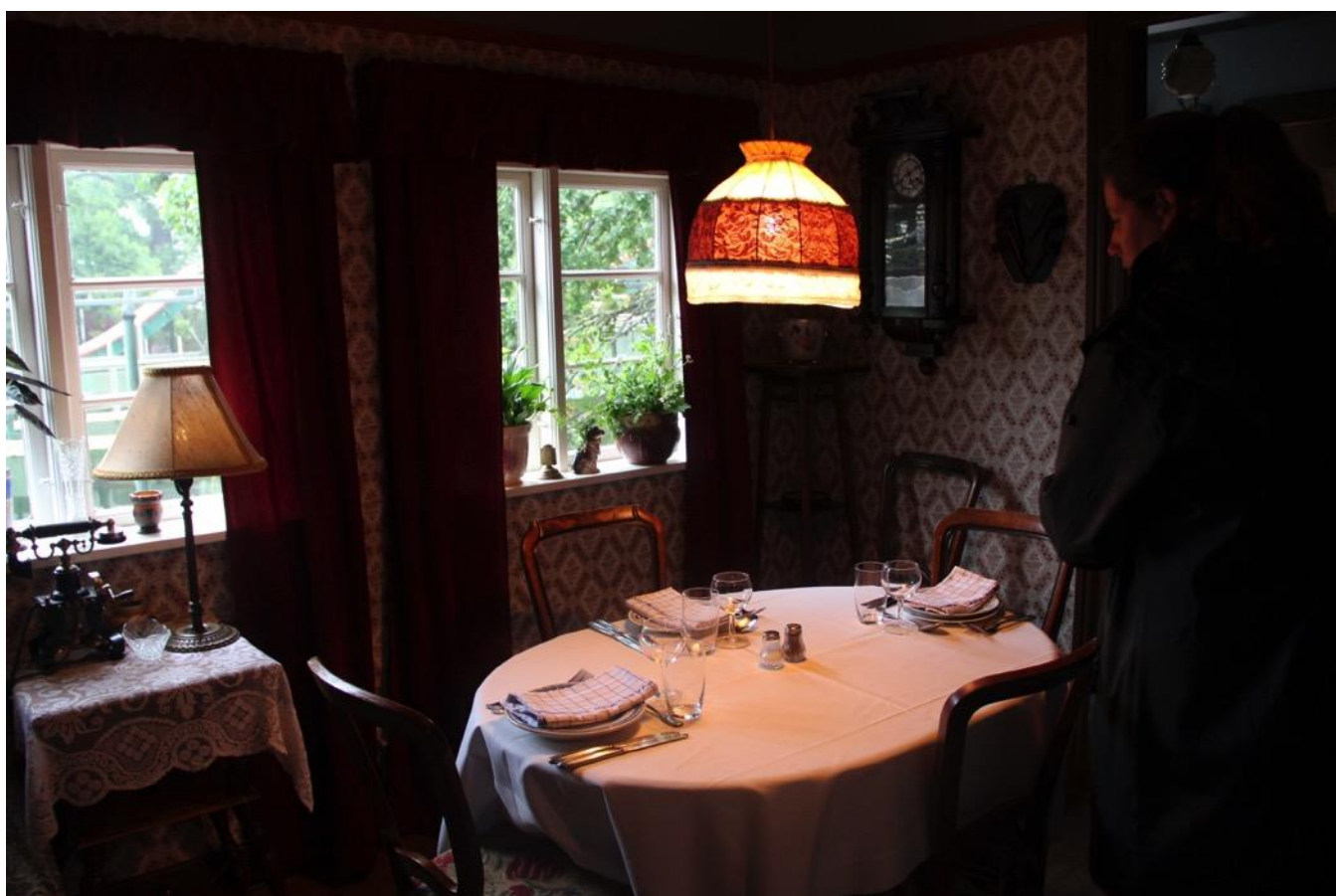
Katrines gård, som også fungerer som restaurant.