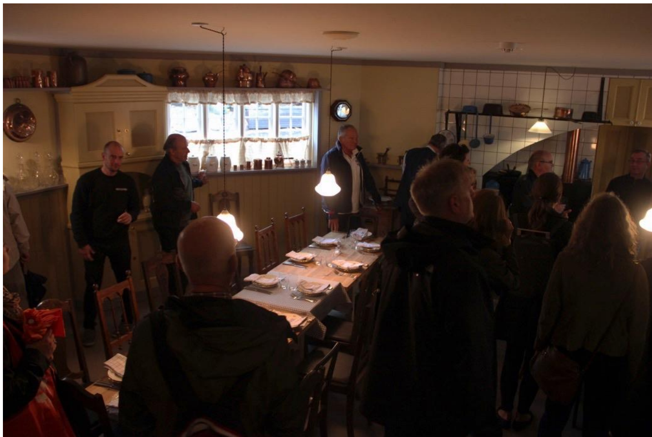
Lauras Køkken som også fungerer som restaurant.