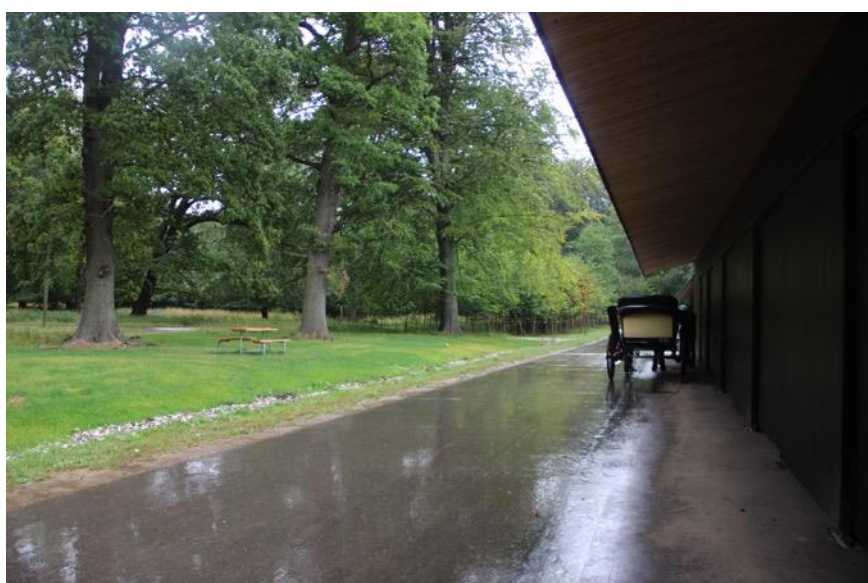
Kaperstaldene i Dyrehaven.