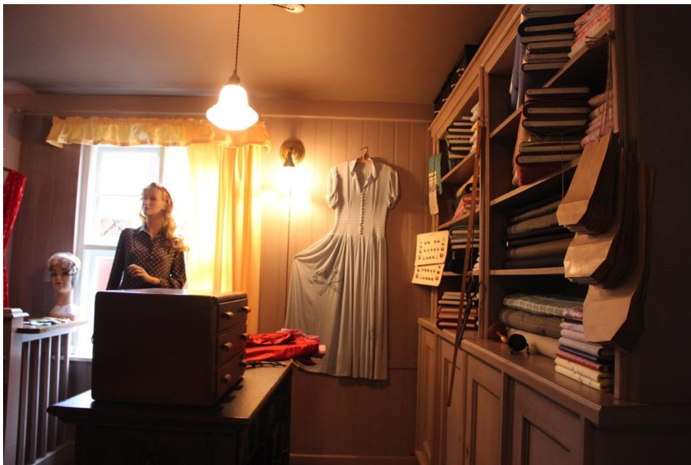
Rundvisningen rundes af i Skjerns Magasin, hvormed vi afslutter en meget hyggelig og spændende formiddag.