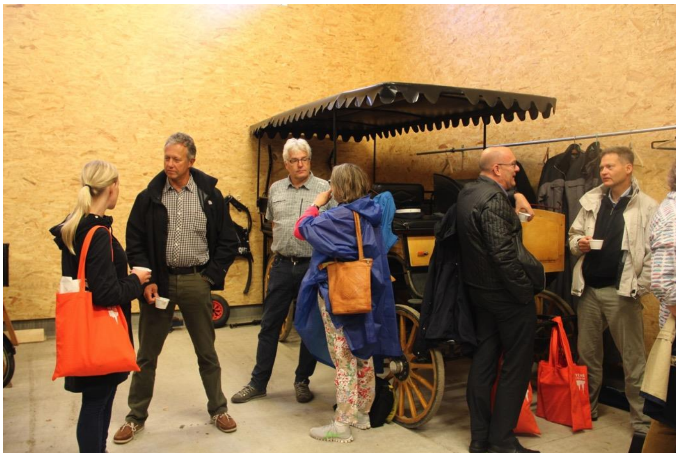
Morgenkaffe, networking og hyggeligt samvær i Kaperstaldene.