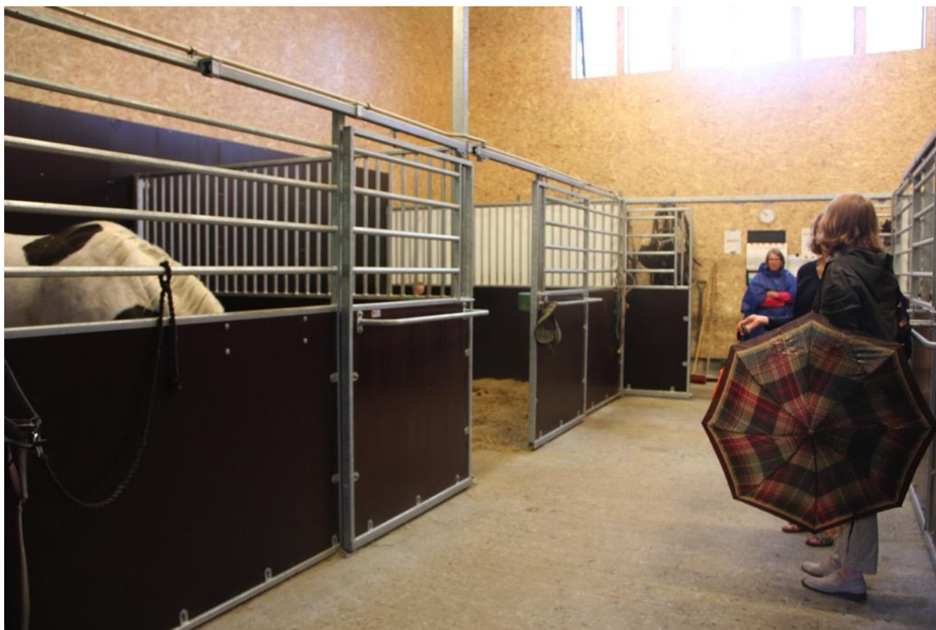
I alt er der plads til 24 heste og 28 vogne i de nye kaperstalde.