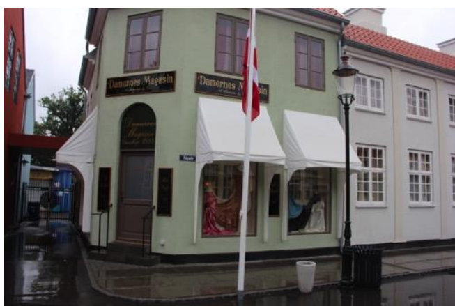
Korsbæk på Bakken

Dagen starter vi med en hestevognstur med afgang tæt på Klampenborg St. hen til Bakken.